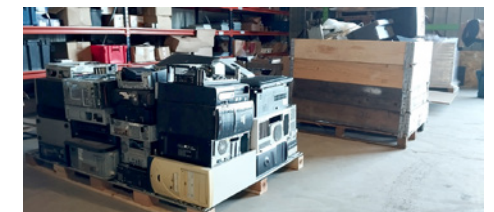
Collecte de déchets, décembre 2023